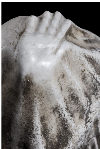
Jago - Prigione (particolare)

In Impronta Animale , la mano si fa reperto: un segno primordiale che richiama le pitture rupestri, rievocando un contatto ancestrale con la terra e con la nostra storia profonda. Memoria , presenta un'impronta di mano scavata nella pietra. L'opera riflette sulla memoria e sull'eredità, rendendo tangibile la traccia della presenza umana come simbolo di permanenza e ricordo. In Prigione , l'immagine scolpita, avvolta nelle pieghe del marmo, sembra voler emergere da una prigione di pietra. I contorni della figura umana sono appena delineati, mentre le membra si estendono con un forte senso di tensione. Il gesto è tutto : urgenza di esistenza, simbolo della lotta per liberarsi da ciò che costringe .