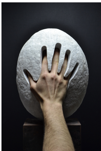
Jago - Impronta Animale