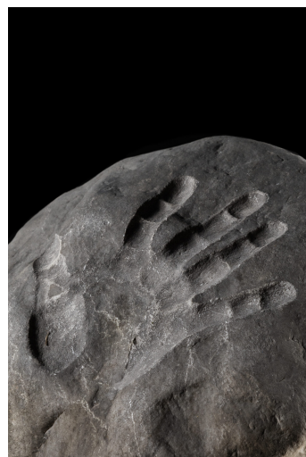
Jago - Memoria (particolare)

La potenza evocativa delle sculture dialoga con la stratificazione storica del luogo, dimostrando la capacità delle sculture di Jago e, più ampiamente, della scultura contemporanea di interrogare il passato e risuonare nel presente.